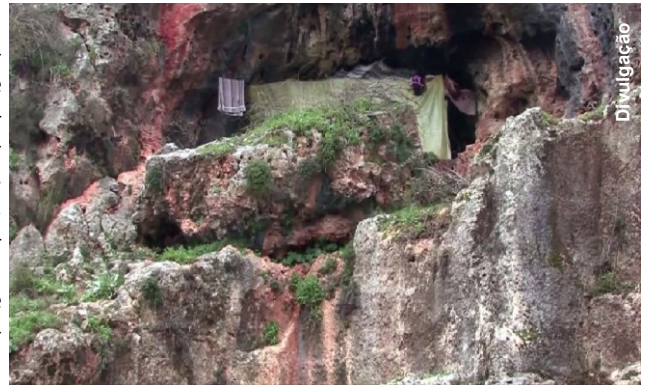
Caverna utilizada para refúgio no Iraque

A situação no norte do Iraque anda extremamente alarmante. Com a revolta do grupo Sunita outros 130 mil refugiados se abrigam em Dohuk, no Curdistão Iraquiano que também enfrenta dificuldades em atender as demandas básicas e médicas aos refugiados. O chefe da Administração Regional do Curdistão, Jabbar Yawar, pediu ajuda internacional aos refugiados. Os yazidis são uma etnia curda ligada ao zoroastrismo, com cerca de 500 mil pessoas no Iraque. Por seu