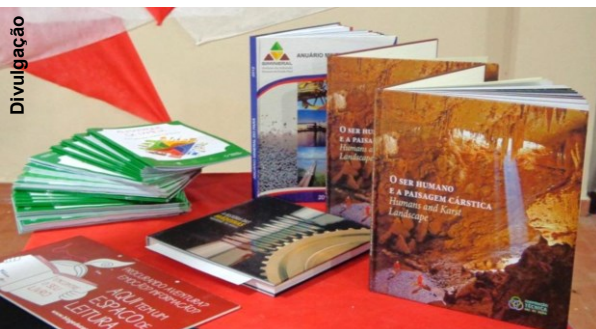
Outras publicações também foram divulgadas no evento

Na tenda de leitura a cooperação técnica esteve representada através de seu livro "O Ser Humano e a paisagem Cárstica". Quem passou pela exposição teve a oportunidade de aprender a importância dos estudos arqueológicos e ambientais na região e ampliar o conhecimento para um mundo ainda tão desconhecido por muitos: o subterrâneo! Os livros foram disponibilizados para consulta à todos os visitantes e recebeu elogios por parte dos interessados.