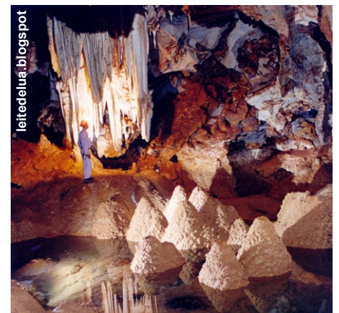
A caverna está interditada desde 2002 por suspeitas de casos de histoplasmose.

No prazo de 12 meses, deverá ser apresentado plano de manejo espeleológico da Gruta Tamboril, segundo as normas do Termo de Referência para o Plano de Manejo Espeleológico de Cavernas com Atividades Turísticas, apresentando-o ao órgão ambiental competente para aprovação. O município terá que executá-lo no prazo de 12 meses, a contar da aprovação. Deverá ser elaborado e executado, também pelo município, projeto