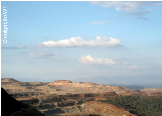
Extração mineral é uma das atividades que causa impactos na região