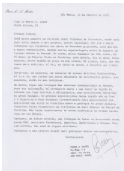
Clique na imagem para ler a carta

Atualmente o GUPE conta com 07 membros fundadores, 13 efetivos e 14 membros colaboradores que trabalham para a preservação dos ambientes cavernícolas de Ponta Grossa e região, nas mais variadas formas e atividades, seja em pesquisa, exploração, monitorias ou outros meios de atuação com a comunidade.