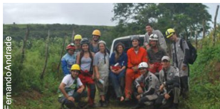
Espeleo Amigos: interligando conhecimento