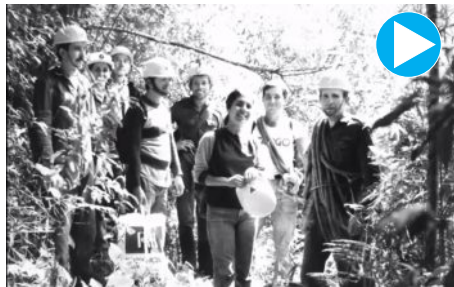
Clique na imagem para assistir o vídeo comemorativo