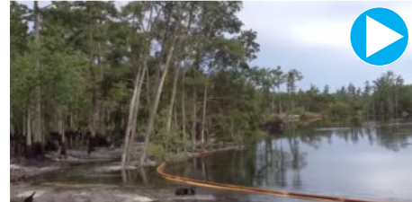
Clique na imagem para ver o vídeo

Um vídeo postado no YouTube mostra o momento em que uma gigantesca cratera, localizada abaixo do pântano em Assumption Parish no estado norte-americano de Louisiana, cresce de tamanho engolindo grandes árvores em questão de segundos.