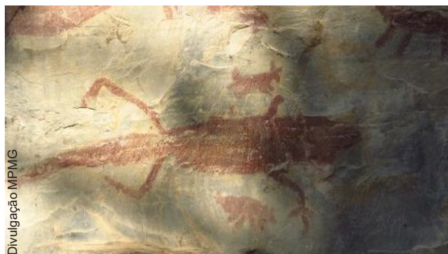
Sítio Arqueológico e Espeleológico foi descrito por Peter Lund