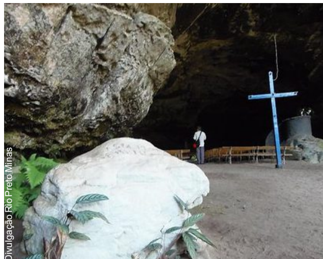
O grupo observou na caverna a presença de opilião, baratas, grilos, morcegos e aranhas.