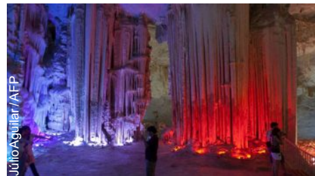
Cavernas têm formações batizadas de 'oitava maravilha'

As grutas de Garcia, no México, atraem muitos turistas que vão até o estado de Nuevo León, no norte do país para contemplar essas belezas.