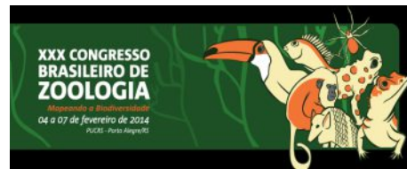
Clique na imagem para acessar a página do evento

Na organização deste, contamos com diversos simpósios que têm como objetivo discutir temas relevantes, polêmicos e metodologias, além de estado da arte de diversos temas da Zoologia Brasileira. Para o congresso organizaremos (Laboratório de Estudos Subterrâneos-UFSCar e colegas de outras universidades/centros de pesquisa) um Simpósio sobre Biologia Subterrânea, que tem como título «Biologia subterrânea: o Impedimento Taxonômico e Proposta de Estratégias para Conservação de uma Diversidade Escondida».