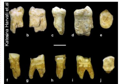
Clique na imagem para acessar o artigo

Um tesouro de fósseis Neandertais, incluindo ossos, foi descoberto numa caverna na Grécia, sugerindo que a área pode ter sido uma encruzilhada fundamental para antigos humanos.