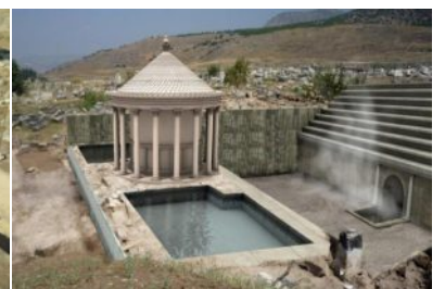
Local pesquisado e simulação de como era antigamente

escapava para a superfície, capazes de matar qualquer ser vivo que se aproximasse de mais da entrada. O local ficava próximo a um templo dedicado a Apolo, e sua associação com a morte foi crescendo por causa dos peregrinos que visitavam o lugar. Os próprios pesquisadores foram testemunhas das propriedades letais da caverna durante as escavações, presenciando a morte instantânea de diversos pássaros que tentavam se aproximar da entrada do local.