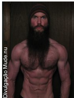
A dieta favorece o aumento de massa muscular