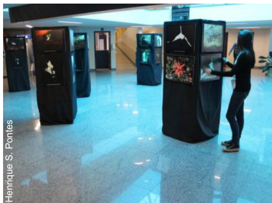
A primeira exposição aconteceu no saguão da reitoria da Universidade Estadual de Ponta Grossa

Grossa e região possuem relacionado às cavernas e ao carste carbonático e não carbonático existente no local.