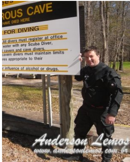
High Springs - Flórida 2010