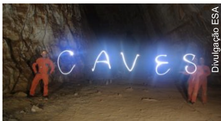
Astronautas no curso de formação CAVERNAS 2012

Um grupo de seis astronautas passa por um treinamento em cavernas da Europa em preparação para viagens espaciais. Segundo a Agência Espacial Europeia (ESA, na sigla em inglês), o grupo multicultural aprende a trabalhar com segurança e a resolver problemas ao explorar uma área desconhecida com procedimentos para uso no espaço. Além disso, eles vão procurar por novas formas de vida em áreas inexploradas.