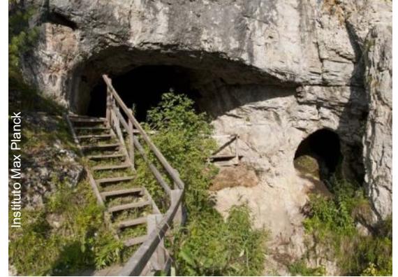
Entrada da caverna Denisova, na Rússia, onde foram encontrados os fósseis

Outro mérito do estudo foi descobrir cerca de 100 mil alterações do genoma humano que aconteceram depois que