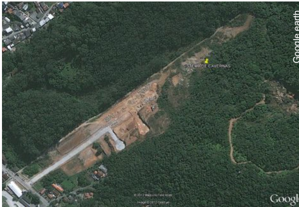
Empreendimento se aproxima do sistema de cavernas

O Sistema de Cavernas da Água Corrente já possui mais de 420 metros entre condutos e galerias. Sequer totalmente explorado e até conhecido, a cavidade megamorfa já se vê ameaçada por um loteamento em construção. A planta do empreendimento não deixa dúvida que alguns lotes e o arruamento principal ficarão a pouquíssimos metros de algumas das entradas da caverna, havendo inclusive risco de soter-