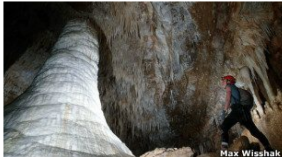
Ambiente isolado e competitivo faz com que bactérias produzam antibióticos