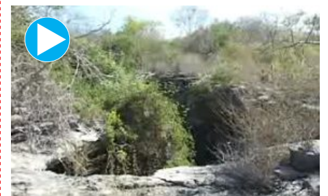
Confira o vídeo clicando na imagem

Uma área com oito mil e quinhentos hectares, no Oeste Potiguar, foi oficializada no mês passado, pelo Governo Federal, como o primeiro parque nacional do Estado. A equipe do in360 foi conferir os trabalhos de monitoramento que o Instituto Chico Mendes está fazendo no local.