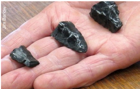
Três ferramentas datadas de 13 mil anos

Pesquisadores americanos descobriram novas provas sobre como os primeiros habitantes da América se espalharam pelo continente. Fósseis de ferramentas de pedra e DNA humano encontrados em cavernas do Oregon, nos Estados Unidos, sugerem que além da já conhecida cultura Clóvis, outro grupo teria ocupado a América.