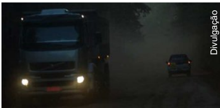
Caminhão de minério em Conceição do Mato Dentro, cidade afetada pela decisão