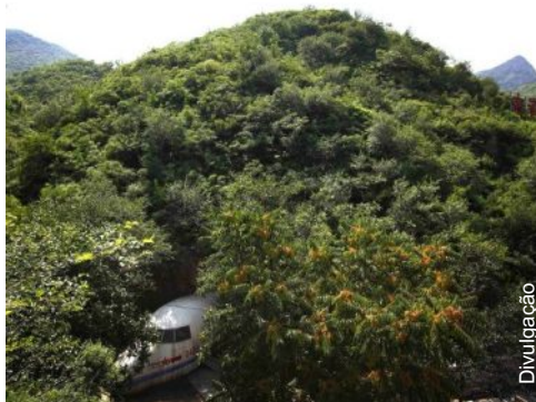
Clique na imagem para conferir mais fotos do local

avião. Ele foi acusado de tentar um golpe para derrubar o presidente Mao e, após morrer, foi considerado traidor pelo Partido