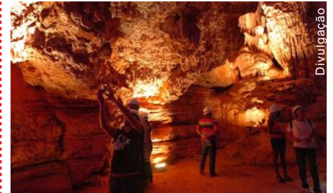
Gruta da Lapinha - Lagoa Santa MG

Mais de 45 mil internautas participaram da escolha das ‘sete maravilhas’ da Estrada Real. Estiveram na disputa 21 paisagens que compõem o roteiro histórico, como igrejas, santuários e parques. Das sete eleitas, seis estão em Minas Gerais. Há paisagens naturais como a cachoeira do Tabuleiro, na cidade de Mato Dentro, monumentos centenários como o Teatro Municipal de Sabará e locais de importância arqueológica, como a Gruta da Lapinha.