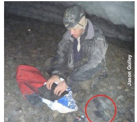
Kinect usado em estudos

O pesquisador Ken Mankoff usou o Kinect - acessório com sensores e câmeras que permite jogar o Xbox 360 apenas com o corpo - para obter imagens em 3D do solo de uma caverna na Noruega. O equipamento registrou os detalhes da superfície com lama e temperatura abaixo de zero.