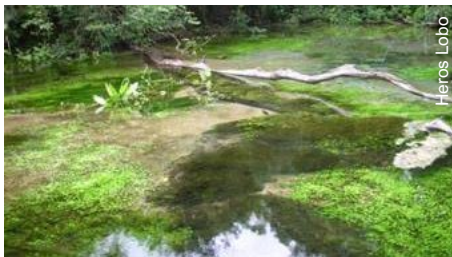
Nascente do rio Sucuri - Bonito MS

A revista Turismo e Paisagens Cársticas (ISSN 1983-473X), editada pela Sociedade Brasileira de Espeleologia (SBE) convida os pesquisadores, técnicos, espeleólogos, planejadores e gestores para a submissão de artigos para o número especial (v.4, n.1, lançamento em julho de 2011, durante o 31º Congresso Brasileiro de Espeleologia) com o tema " Uso turístico da água em áreas cársticas ".