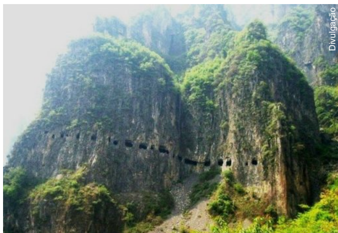
O túnel foi escavado com ferramentas rudimentares