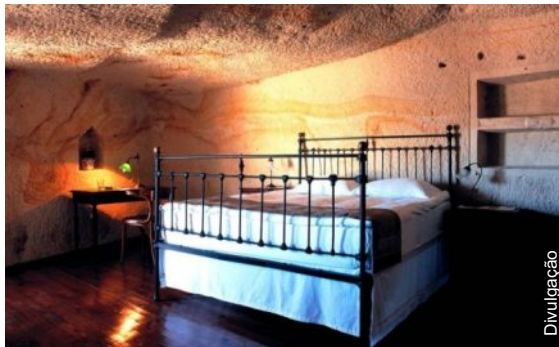
Chão de madeira aquecido e banheiros de mármore

Datadas do século V e VI, elas foram transformadas em 2000 em um complexo de 30 quartos. Cada um deles é equipado com chão de madeira aquecido, banheiros de mármore, móveis feitos à mão, varandas privativas e jacuzzi. Todos os aposentos ainda são conectados a uma mansão grega