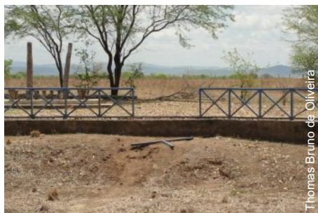
Equipamentos sem manutenção mínima

Considerado como importante monu- mento natural do estado da Paraíba e um dos grandes e mais significativos aflora- mentos de iconofósseis do mundo, o Vale dos Dinossauros há muito tempo pede socorro. Está entregue ao Deus dará.