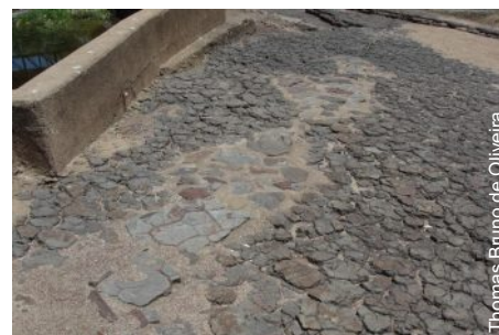
Registros apagados pelo descaso

mente, gerando emprego e renda para as comuni- dades locais. No Brasil, me parece que é mais vanta- joso o esquecimento, a desolação e o uso indevido da imagem de destruição dos monumentos em meros discursos ontoló- gicos políticos.