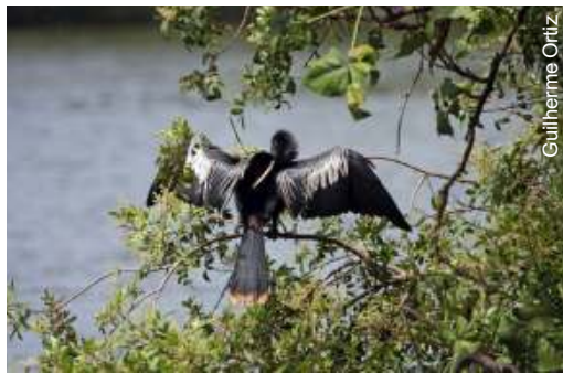
Biguatinga - Anhinga anhinga

Na apresentação foram elencados os locais mais propícios para a prática do Birdwatching em Campinas, entre eles, a Lagoa do Taquaral, o bairro Vale das Garças em Barão Geraldo, os distritos de Souza e Joaquim Egídeo, o Parque Ecológico e o Bairro Carlos Gomes, dentre outros locais. Nas saídas do GOAC, já foram avistadas quase 240 espécies somente na cidade de Campinas.