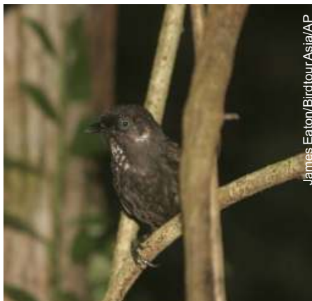
Ave encontrada na região cárstica de Nonggang