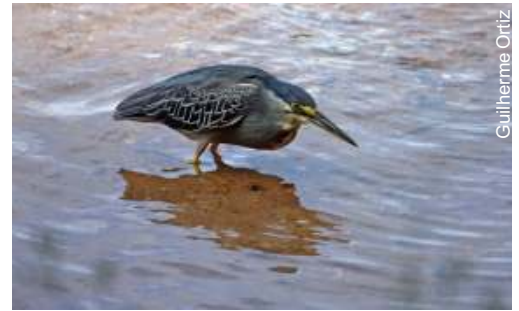
Socozinho - Butorides striatus

Outra ferramenta bastante importante e que ajuda na aproximação das aves é o play back, a reprodução do som de uma