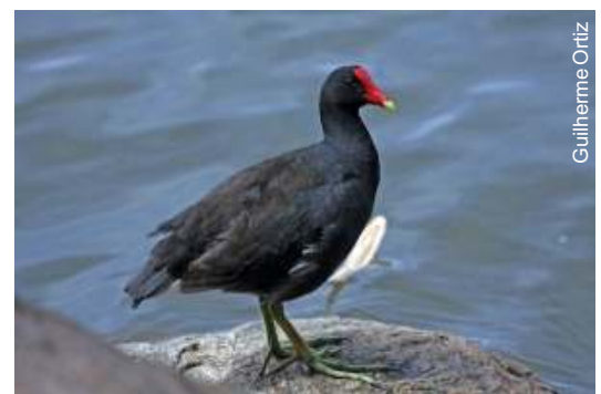
Frango D'água - Gallinula chloropus

A prática de observar às aves deve ser feita em grupo, tanto pelo fato de ser mais seguro, e também pela ampliação dos sentidos, ou seja, em um grupo, sempre haverá alguém mais experiente, aumentando o conhecimento dos colegas e a precisão dos registros.